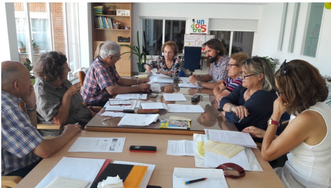
Jurado del Concurso

Para continuar con la relación existente entre el Centro y los niños y niñas de la ciudad, se ha fallado el I Concurso de Relatos organizado por la AFA.