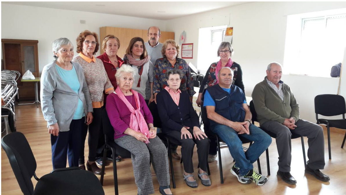
Asistentes a la terapia en Magaz de Cepeda