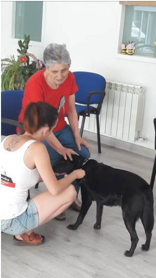
Terapia con perros