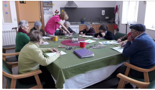
Para activar la memoria