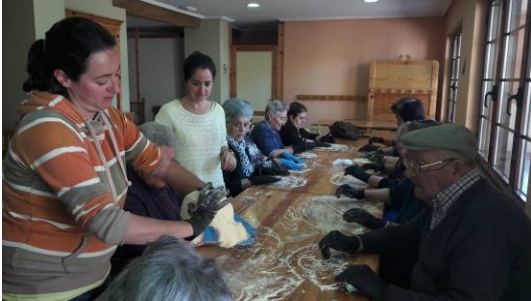
Amasando el pan

Talleres en Hospital de Órbigo: Durante varias semanas acuden a Hospital, a la granja escuela para realizar diversas actividades.