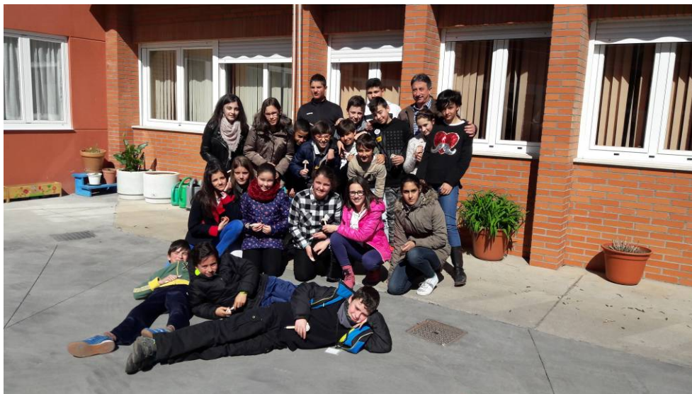
ALUMNOS Y ALUMNAS DE 6º DEL C.E.I.P. BLANCO DE CELA DE ASTORGA

Esta carta ha sido escrita por el alumnado de Blanco de Cela. Será otro colegio el que se dirija al centro de Alzheimer el próximo curso.