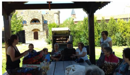
Trabajamos las flores secas para hacer adornos

Finalizan los talleres de primavera de la AFA