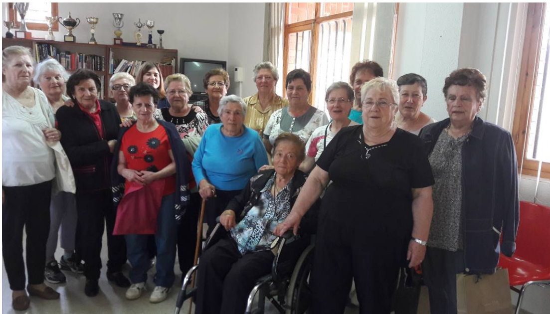
Asistentes a la terapia en Villamejil

Aparte de las terapias que se realizan en el centro, dos ayuntamientos (Magaz de Cepeda y Villamejil) llevan a cabo terapias para activar la memoria de sus ciudadanos.