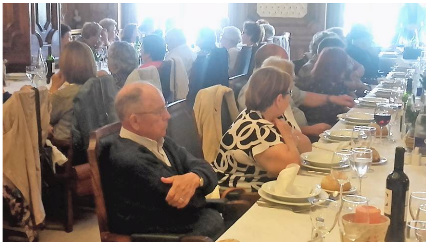
Entrega de premios del I Concurso de Relatos para escolares