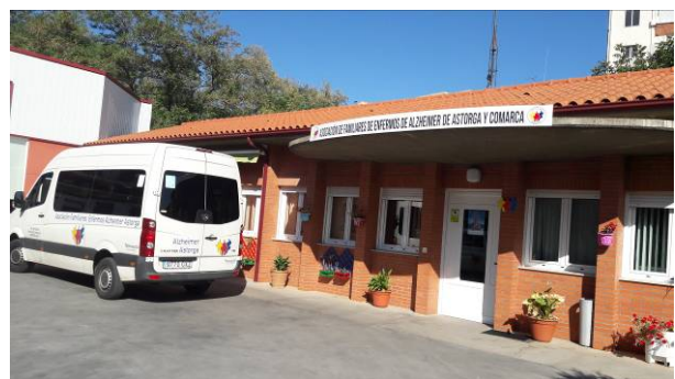
Centro de día en la actualidad