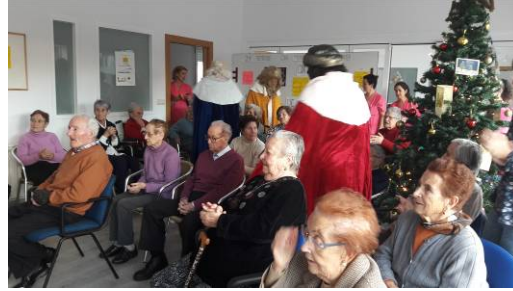
Celebrando el Carnaval: acompañados por la orquesta "Aires de Perales"