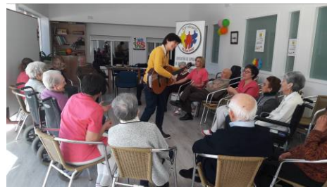
Taller de Musicoterapia

Peleándose con las nuevas tecnologías: Durante varias viernes acuden al centro de las CEAS para “pelearse” con los ordenadores .