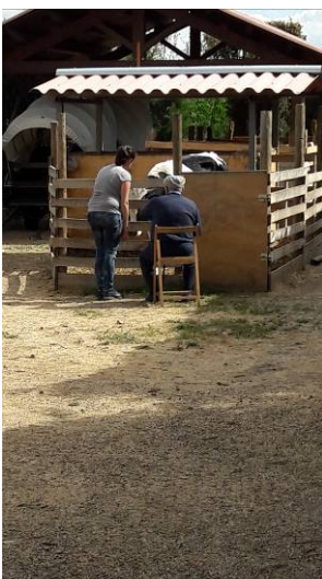
Cuidando los animales