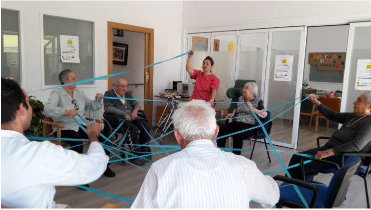
Terapia con cintas