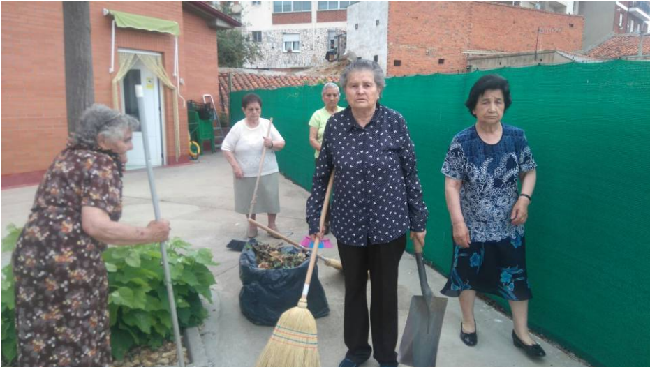
Tenemos el patio cuidado y limpio